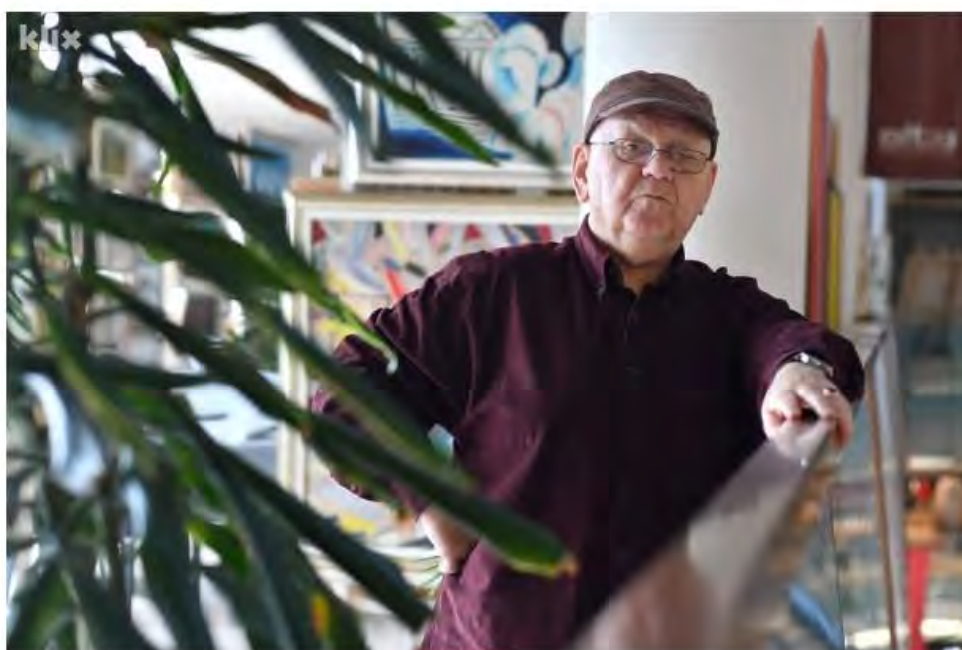
Abdulah Sidran

Akademik i bh. pjesnik Abdulah Sidran je svojim književnim i filmskim radom dao nemjerljiv doprinos bh. kulturnoj sceni proširivši njenu važnost i značaj i na mnogo šire prostore. Iako su mu iskrenost, neposrednost i direktnost donijeli mnogo nevolja, uvijek je bio i ostao dosljedan sebi. Anomalije društva danas kritikuje putem društvenih mreža, no to je samo jedna od tema o kojima je Sidran otvoreno govorio u razgovoru za Klix.ba.